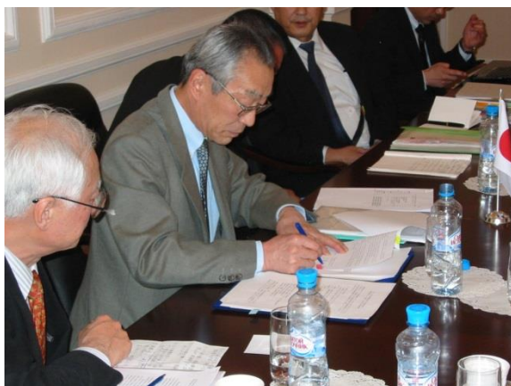
議定書に署名（日本側代表）